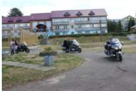
Встреча с байкерами