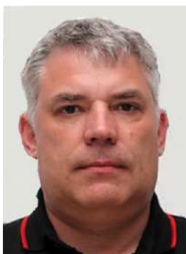
Офицер по связи с участниками