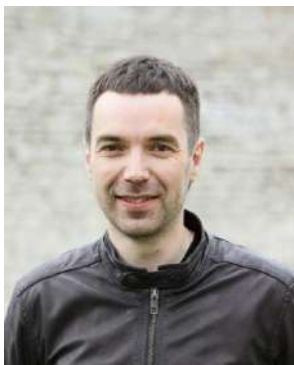
Главный судья (Руководитель гонки)